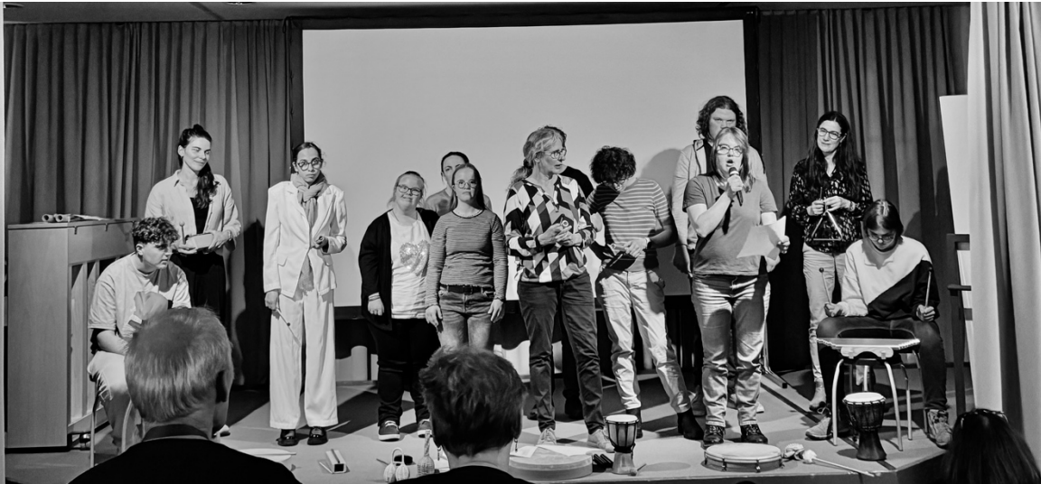
21.März 2025, Jugendgruppe und Club im Dreiländermuseum in Lörrach.

Der Verein JuGru bietet zwei Gruppen an: die Jugendgruppe für Jugendliche (seit 2012) und der Club für junge Erwachsene (seit 2018). Junge Menschen mit einer leichten geistigen Beeinträchtigung treffen sich in ihrer Freizeit ausserhalb der Familie. Sie erzählen einander, was sie beschäftigt und entscheiden zusammen, was sie tun wollen. Ausbildung, Freundschaft, Liebe, die Ablösung von Zuhause stellt junge Menschen mit Beeinträchtigung vor spezielle Herausforderungen. In den Gruppen des Vereins JuGru treffen sich junge Menschen in ähnlichen Situationen. Einmal mehr zeigte sich, was künstlerisches Tun bewirken kann: Selbstvertrauen, Verarbeitung von Sorgen und Verbindung in der Gruppe. Die Gruppen sind mit Bildern und einem musikalisch-poetischen Auftritt im DreiländerMuseum Lörrach aufgetreten.